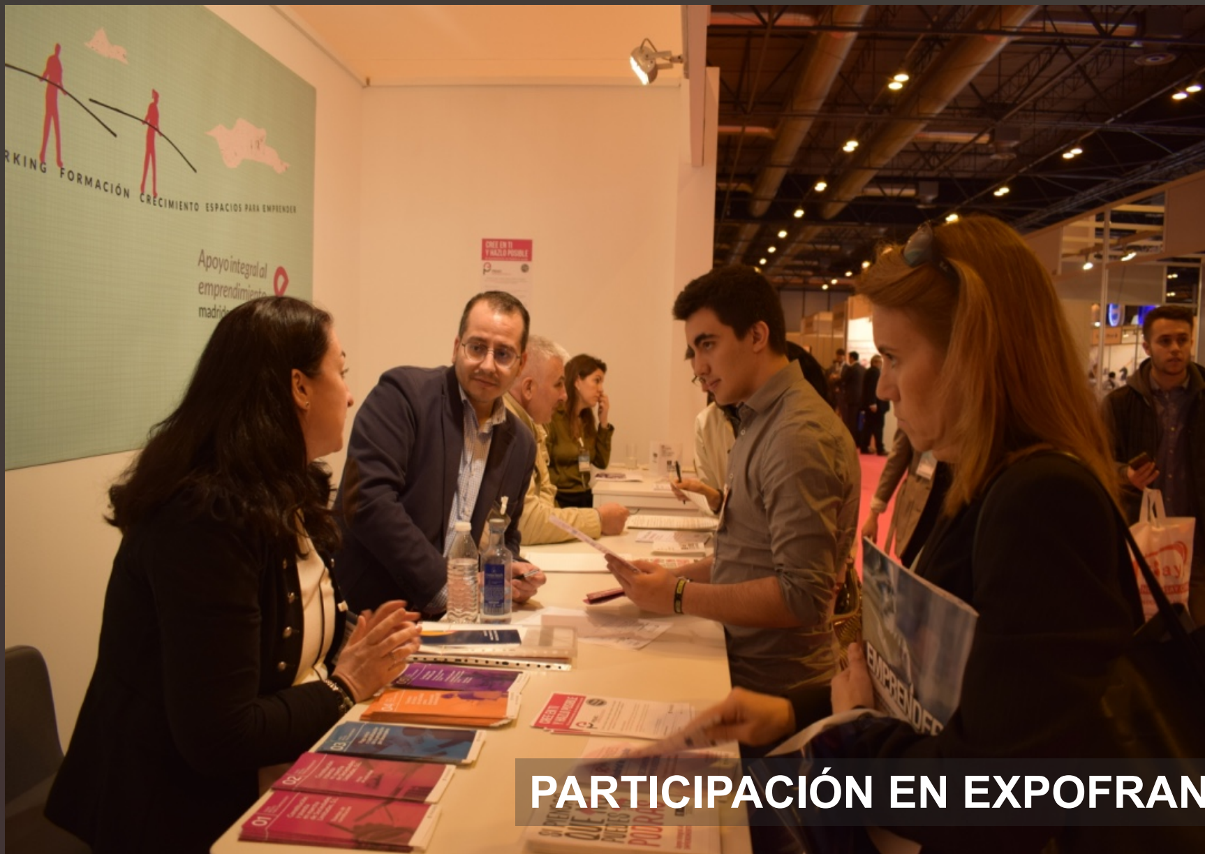
PARTICIPACIÓN EN EXPOFRANQUICIA