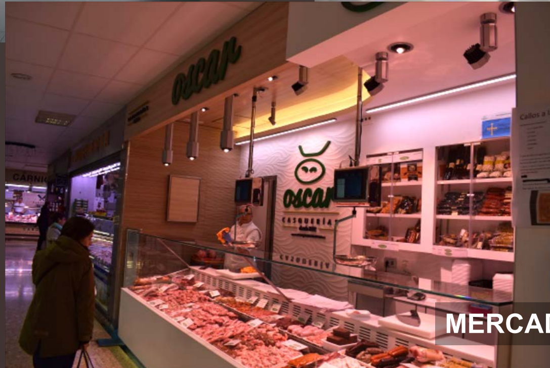
MERCADO DE LAS ÁGUILAS