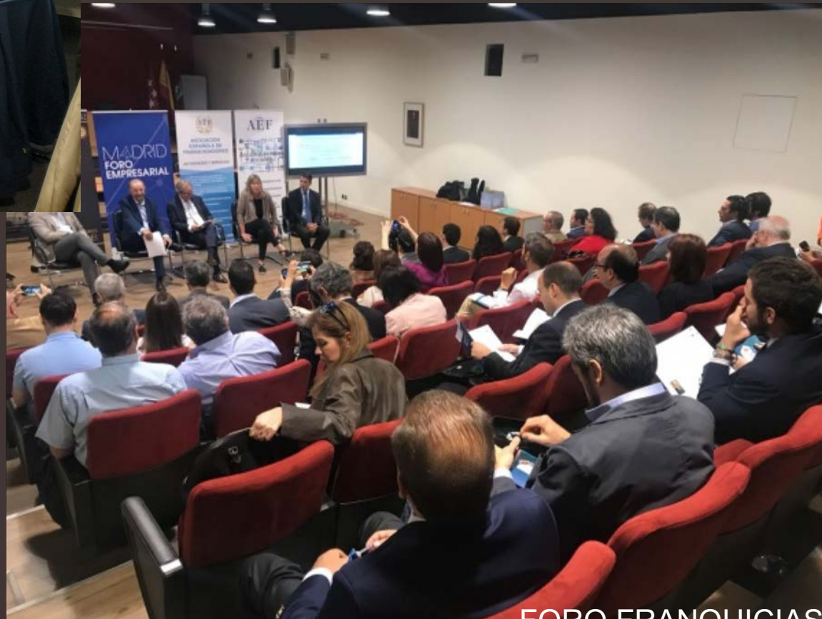
FORO FRANQUICIAS EN COLABORACIÓN CON MADRID FORO EMPRESARIAL