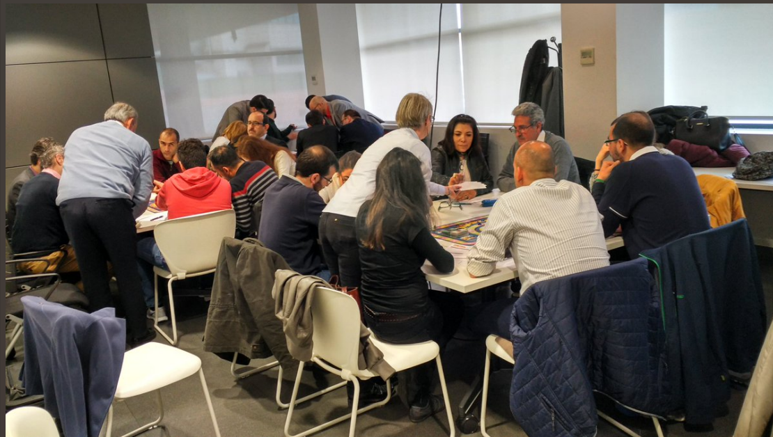
ESCUELA DE COMERCIO