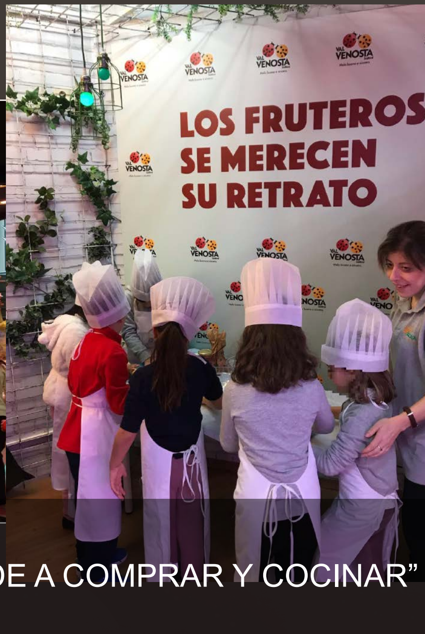
Programa "APRENDE A COMPRAR Y COCINAR"